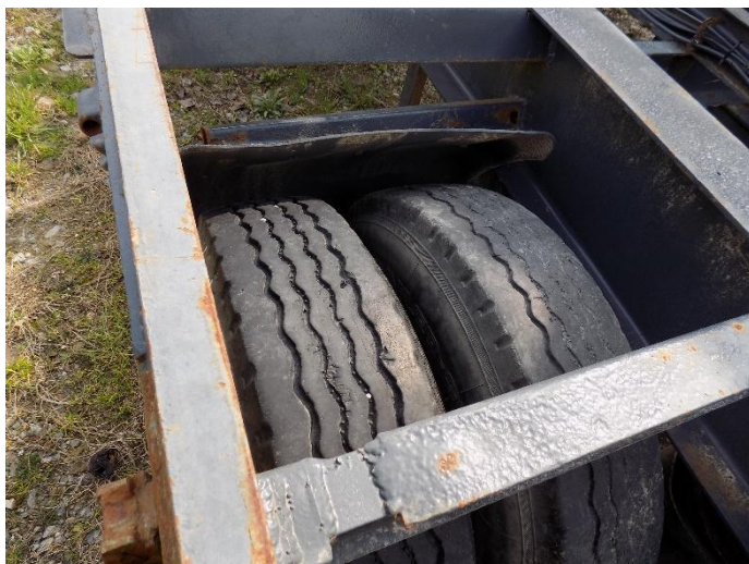
1. KRONE ADP 24 - stanje guma

Franje Kuhača 8, 43000 Bjelovar, tel: 043/246-999, mob: 098/449-984, mail: kresimir.antulov@gmail.com