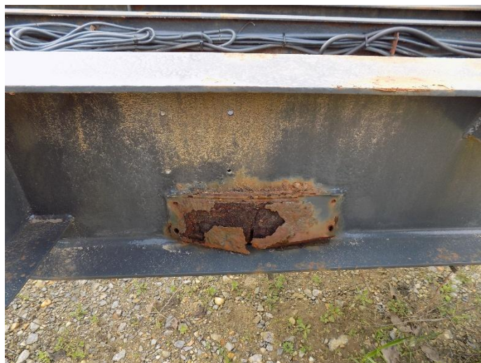
2. KRONE ADP 24 – puknuće šasije