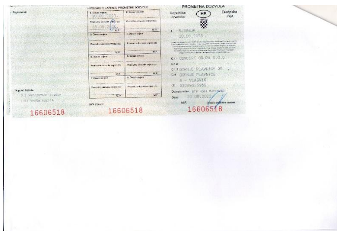
5. KRONE ADP 24 – prometna dozvola