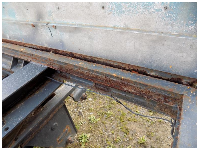
3. KRONE ADP 24 – zahvaćenost korozijom